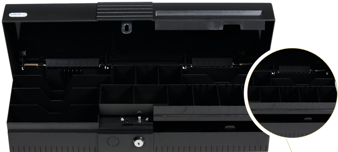
Kassette mit 9 Münzfächern