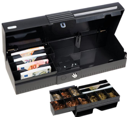
Individuelle Bestückung mit Münzfächern