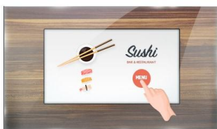
Touch durch Glas

Der 15.6 (39.5 cm) ProLite TF1615MC-B1 verwendet die PCAP-Touch-Technologie und ist verbaut in einem formschönen Edge-to-Edge Glas Design. Dank seiner Glasauflage und dem robusten Rahmen garantiert der Bildschirm eine hohe Haltbarkeit und Kratzfestigkeit und ist somit ideal für Kiosksysteme und Anwendungen im öffentlichen Einsatz geeignet. Ausgestattet mit einer Schaumstoffdichtung bietet das Gerät eine nahtlose Integration in Kiosksysteme. Mit der IP65 Zertifizierung bietet das Gerät eine Staub- und Wasserresistenz in der Bedienung. Die Ausrichtungsoptionen Quer- Hoch- und Face-Up-Format sorgen für flexible Montagemöglichkeiten, dazu kann es mit separat erhältlichen Befestigungswinkeln ( OMK5-1 ) ausgestattet werden, die den Einbau erleichtern. Die ideale Lösung für Kiosksysteme, industrielle Umgebungen, Kontrollräume und interaktive Multimedia-Anwendungen.