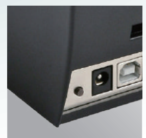
Einfaches und schnelles Kalibrieren von Etiketten durch die innovative Kalibrierungstaste