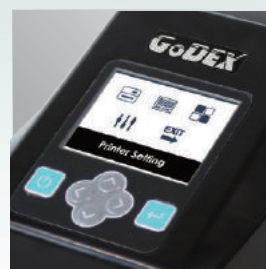
2,4"-Farb-Display und Bedienfeld für einfache und intuitive Benutzung