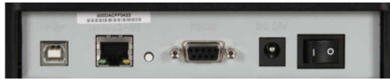
Ethernet LAN, USB und serielle Schnittstelle standardmäßig