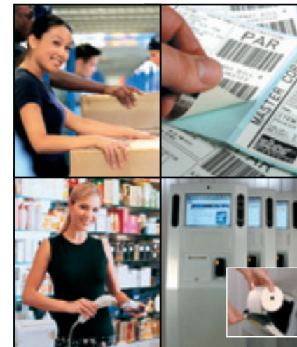
Multifunktionaler Hochgeschwindigkeitsdrucker, ideal für Etiketten, Barcodes, Tickets und Kioskanwendungen