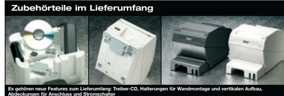
Es gehören neue Features zum Lieferumfang: Treiber-CD, Halterungen für Wandmontage und vertikalen Aufbau, Abdeckungen für Anschluss und Stromschalter