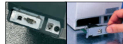
Es sind Modelle mit seriell, parallel und USB-Anschluss sowie eine schnittstellenfreie Version zur Verwendung mit Ethernet oder WiFi erhältlich