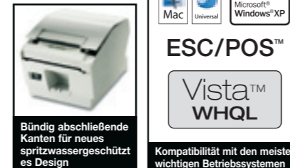
Bündig abschließende Kanten für neues spritzwassergeschütztes Design