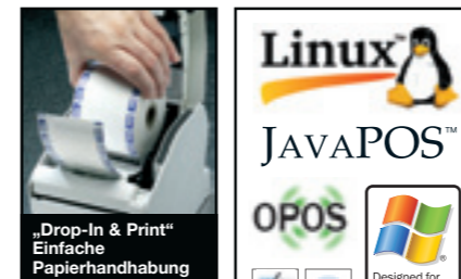
„Drop-In & Print“ Einfache Papierhandhabung